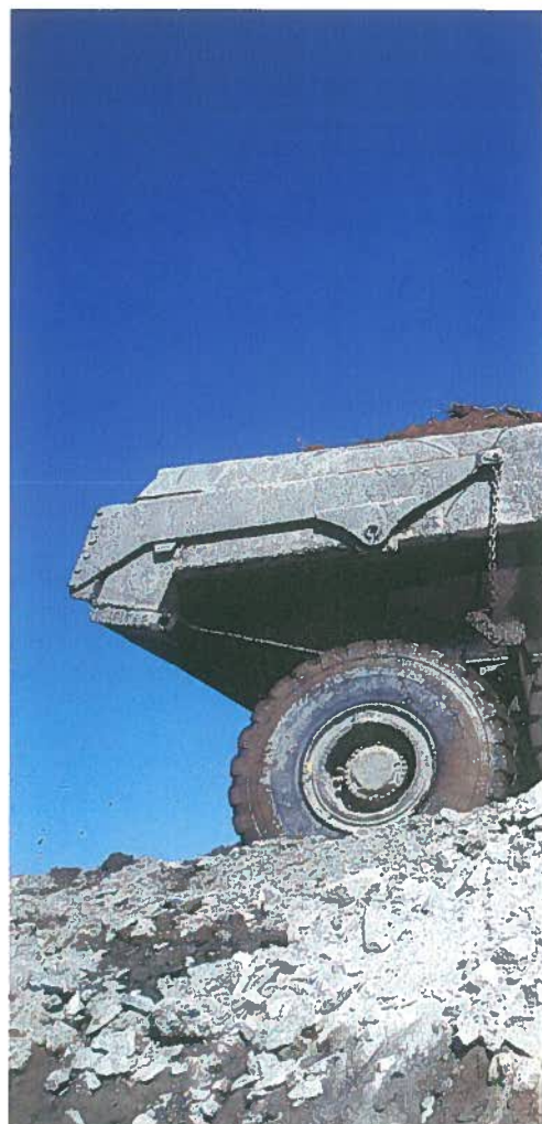
Kaivosalueella syntyvä kiviaines käytetään pääasiassa kaivoksen